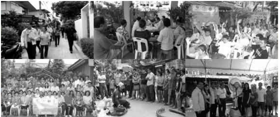
ภาพ2 กระบวนการมีส่วนร่วมของสมาชิกชุมชนเพื่อพัฒนาและแก้ไขความเหลื่อมล้ำทางสังคม

แสดงเป็นรายประเด็น พบว่า สภาพปัญหาความเหลื่อมล้ำทางสังคมของการมีส่วนร่วมในการแสดงความคิดเห็นและการตอบสนองของรัฐต่อความคิดเห็นของชุมชนมีระดับคะแนนความพึงพอใจ น้อยที่สุด ทั้งในอดีตและปัจจุบัน ส่วนความคาดหวังในอนาคต มีระดับคะแนนความพึงพอใจที่คาดหวังจะให้เกิดมากที่สุด ในประเด็นการเข้าถึงระบบการศึกษาและการพัฒนาเยาวชนและการพัฒนาทางกายภาพของชุมชน