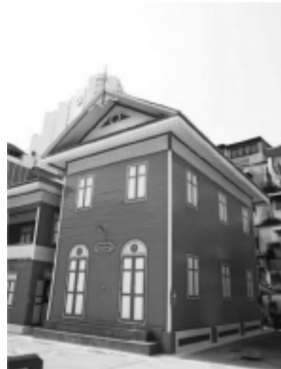
รูปที่ 8 ลวดลายไม้ฉลุที่เหนือหน้าต่าง อาคารโรงเรียนพันรชาคาร วัดสวนพลู