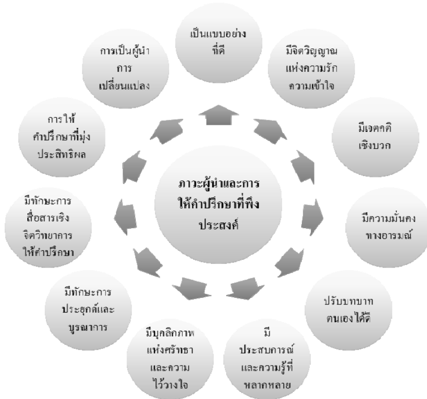
ภาพ 3 ตัวแบบภาวะผู้นำและการให้คำปรึกษาเด็กและเยาวชนที่กระทำคามผิดทางอาญา

สถิติดังกล่าวชี้ให้เห็นถึงประสิทธิผลของศาลเยาวชนและครอบครัวทั่วประเทศในการนำเครื่องมือต่างๆ