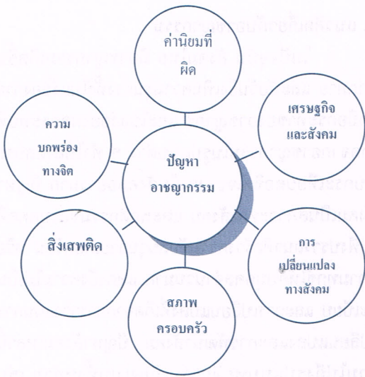
ภาพ 1 สาเหตุปัญหาอาชญากรรม

และกระตุ้นเตือนให้ประชาชนมีส่วนร่วมในการพัฒนาชุมชนให้มีสภาพความเป็นอยู่ที่ดีขึ้น ในเรื่องเกี่ยวกับสภาพครอบครัว และชุมชน ปัญหาสำคัญที่มีแนวโน้มที่จะก่อให้เกิดปัญหาอาชญากรรม ได้แก่ ปัญหาภายในครอบครัว ปัญหาสิ่งแวดล้อมรอบบ้าน ปัญหาความปลอดภัยในชีวิตและทรัพย์สิน และสภาพความปลอดภัยและสภาพแวดล้อมในชุมชน (โสภา ชูพิกุลชัย ขปีถมนันท์, 2548, หน้า 88)