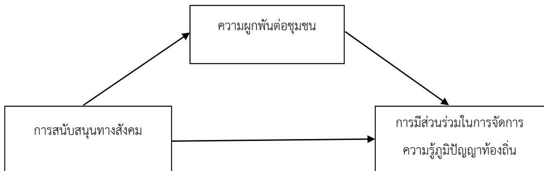
ภาพ 2 กรอบแนวคิดในการวิจัย

กลุ่มตัวอย่าง คือ สุ่มตัวอย่างแบบหลายขั้นตอนจากนักเรียนที่กำลังศึกษาในชั้นมัธยมศึกษาตอนปลาย ในอำเภอปักธงชัย ใช้การสุ่มแบบแบ่งกลุ่ม แบ่งออกเป็น