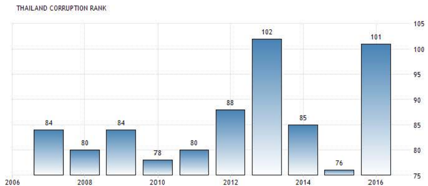
ภาพ 1 Corruption Perceptions Index Rank ของประเทศไทย

จากภาพที่ 1 ได้แสดงถึงสถานการณ์การรับรู้ด้านคอร์รัปชันในประเทศไทย โดยในปี 2013 ประเทศไทยได้ถูกจัดอันดับอยู่ที่ 102 และในปี 2014 ประเทศไทยได้ถูกจัดอันดับลดลงมาอยู่ที่ลำดับ 85 และในปี 2015 ก็มีอันดับลดลงโดยมีลำดับที่ 76 แต่ในปี 2016 ประเทศไทยกลับถูกจัดอันดับสูงขึ้นอย่างน่าตกใจ โดยมีลำดับที่ 101 จากจำนวนประเทศทั้งหมด 176 ประเทศ โดยในปี 2016 ประเทศไทยมีคะแนนรวมเท่ากับ 35 คะแนน จากคะแนนเต็ม 100 (Transparency International, 2016) แสดงให้เห็นถึงความไม่แน่ใจที่เพิ่มสูงขึ้นขององค์การต่างชาติที่มีต่อประเทศไทยในการจัดสรรทรัพยากรสาธารณะซึ่งจะส่งผลสืบเนื่องไปสู่การส่งมอบบริการสาธารณะอย่างมีคุณภาพภายใต้ค่าใช้จ่ายที่สมเหตุสมผลของภาครัฐ จากปรากฏการณ์ดังกล่าวได้แสดงให้เห็นว่าการศึกษาที่เกี่ยวข้องกับการต่อต้านคอร์รัปชันเป็นสิ่งสำคัญและน่าสนใจที่จะทำการศึกษาอย่างยิ่ง